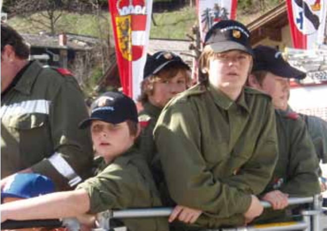
Nach geleisteter Arbeit durfte die Jugend mit dem Hubsteiger in luftige Höhe abheben.