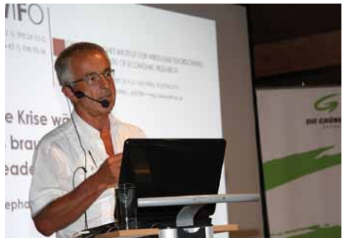
WIFO-Experte Stephan Schulmeister referierte zur Finanzkrise

Besonderes Augenmerk legten wir auf umweltfreundliche Anreise und umweltfreundliche Mobilität im Ort: Gratistransfer vom Bahnhof und Gratis-Shuttle in Goldegg während der Tagung wurden durch maßgebliche Unterstützung der SalzburgAG, von ElectroDrive sowie der Firma ALBUS ermöglicht. Im Schloss wurden bereits vorher zahlreiche energie- und wassersparende Maßnahmen getroffen, die Cateringbetriebe wie das „Cafe im Schloss“, der Gasthof „Bierführer“ und der „Pongauer Bauernladen“ versorgten