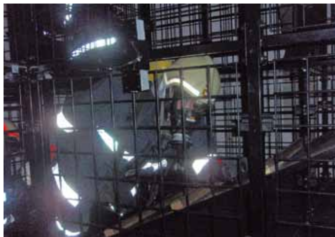
Atemschutzträger in Aktion bei der Übungsstrecke.