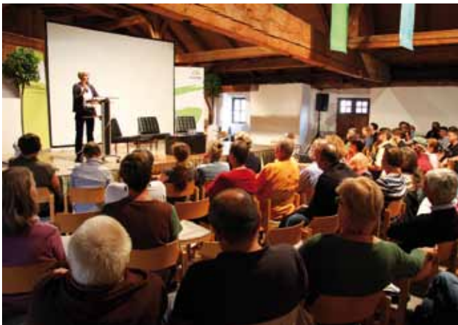
Volles Haus bei der Sommerakademie, hier beim Vortrag der bekannten deutschen Autorin Ulrike Herrmann