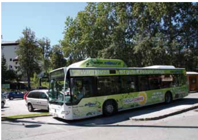
ALBUS stellte einen umweltfreundlichen Gas-Bus für den Transfer zum Bönldsee zur Verfügung

Unser Schloss Goldegg ist damit der erste Tagungsort im Innergebirg, der das „Umweltzeichen für Green Meetings“ führen darf. Gemeinsam mit den MitarbeiterInnen im Schloss und in der Gemeinde haben wir für die erste „Green Meeting“-Tagung die Voraussetzungen geschaffen: