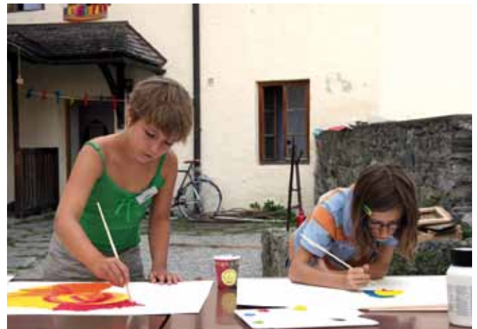
Rund 30 Kinder nahmen an der Kinder-Sommerakademie teil