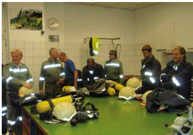
Atemschutzwerkstätte hier werden auch die Flaschenfüllungen (300bar) für die Feuerwehren durchgeführt.

Die Feuerwehr Goldegg führt jeweils am Freitag regelmäßige Übungen (Interessierte Jugendliche oder Gemeindebürger können gerne schnuppern) durch. Anlässlich dieser Ausbildungen war die Feuerwehr Goldegg bei der Atemschutz-Übungsstrecke in Bischofshofen. Dabei übten 4 Gruppen zu 3 Atemschutzträgern (1 Atemschutztrupp besteht immer aus 3 Mann). Diese Atemschutzübungsstrecke besteht aus einem Irrweg in Käfigform wobei man mit voller Atemschutzausrüstung eine Vielzahl von eingebauten Hindernissen bei völliger Dunkelheit überwinden muss. Dies ist wichtig um sich im Einsatzfall richtig zu verhalten. Atemschutzträger müssen in körperlich und gesundheitlich guter Verfassung sein, diese müssen sich auch einer gesundheitlichen Untersuchung in bestimmten Abständen unterziehen. In Bischofshofen befindet sich der Stützpunkt des Bezirkes Pongau für Atemschutz.